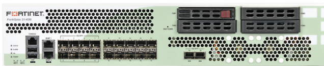
FortiGate-3140B アプライアンス (正面)