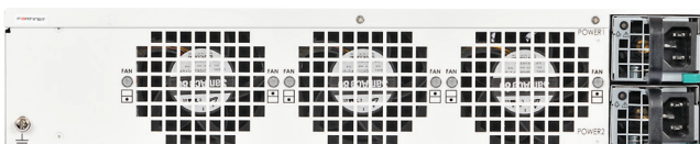
FortiGate-3140B アプライアンス (背面)