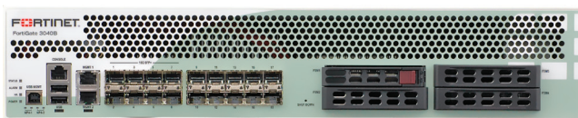
FortiGate-3040B アプライアンス (正面)