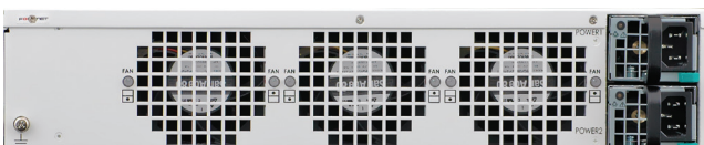
FortiGate-3040B アプライアンス (背面)